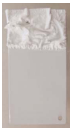
Peinture PU bi-composante DÉCAPANT CLASSIQUE à base de Chlorure de Méthylène, début de cloquage après 12 minutes.

La plupart des décapants sont formulés avec du Chlorure de Méthylène ou de la Méthyl Ethyl Cétone. Outre les critères de toxicité ou d'inflammabilité de ce solvant, sa vitesse d'évaporation est extrêmement rapide, inférieure à 1 minute ; son temps d'action est donc réduit, et limite son efficacité aux revêtements dont le décapage est aisé. DEXCEL REV 85 L est garanti sans ces composés. Ses constituants actifs sont efficaces jusqu'à 6 heures, et permettent l'élimination de résines fortement réticulées.