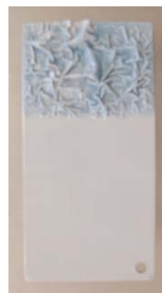
Peinture PU bi-composante DEXCEL REV 85 L début de cloquage après 9 minutes.